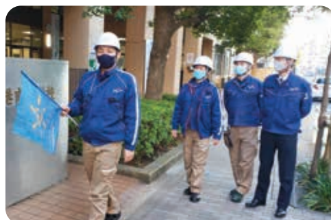
避難場所まで移動