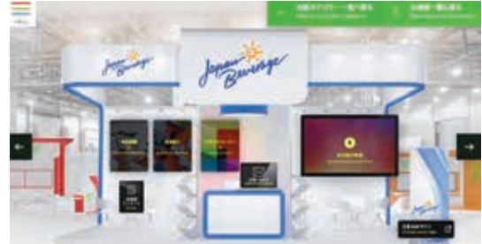
ジャパンビバレッジエコロジー 川崎国際環境技術展 (オンライン開催)