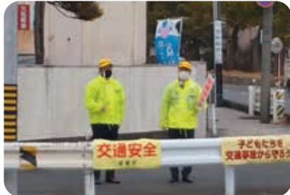
豊田支店 交通安全県民運動街頭立哨