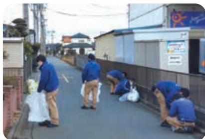
所沢支店 支店周辺清掃活動

支店周辺のゴミ拾いや地域団体主催の清掃イベントに参加することで、事業所近隣の環境美化に取り組んでいます。