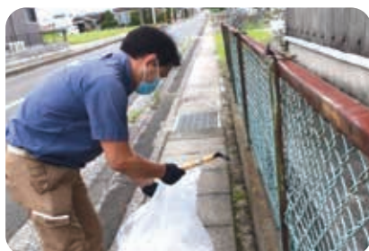
北大分支店 中津商工会議所一斉清掃活動