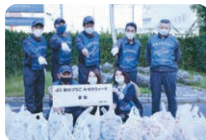
ジャパンビバレッジエコロジー 秋のプラごみゼロウィーク活動