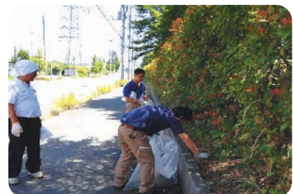
船橋支店 支店周辺清掃活動