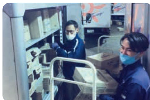
帰社後のヘルプ体制