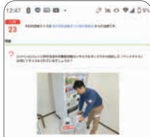
府中支店 府中市民協働まつり (オンライン開催)