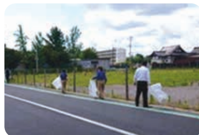
千葉支店 支店周辺清掃活動