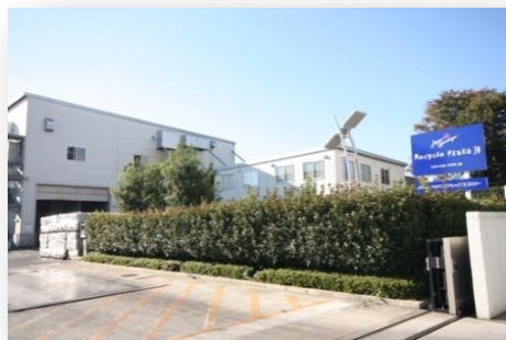
さいたま市北区吉野町